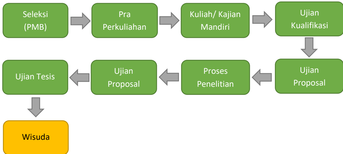
Gambar 2 Bagan Alir Proses Pendidikan di SPs UNPAK